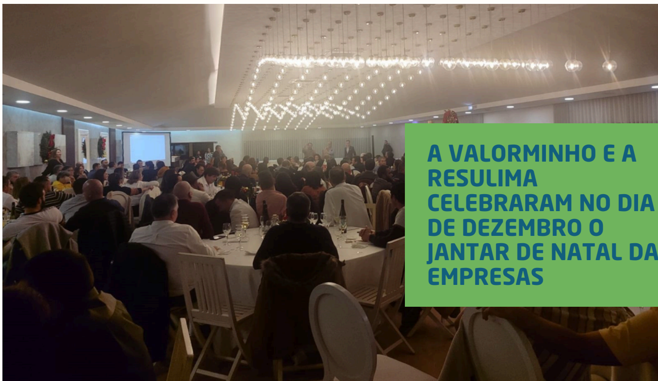
A VALORMINHO E A RESULIMA CELEBRARAM NO DIA 7 DE DEZEMBRO O JANTAR DE NATAL DAS EMPRESAS

Num espírito familiar, e contando com a presença dos colaboradores que diária e incansavelmente asseguram que os resíduos produzidos são utilizados como recursos,